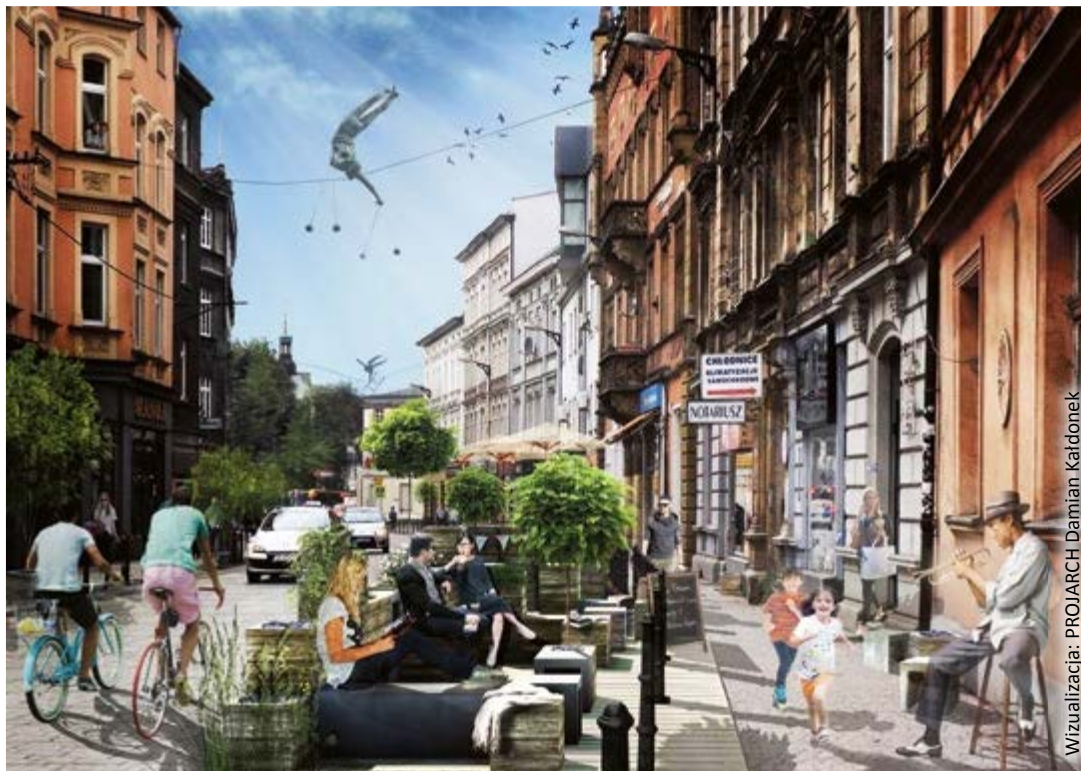
Wizualizacja: PROJARCH Damian Kałdonek

Na 10 parkietach ustawionych na chodnikach i jezdni staną ławki, pojedyncze siedziska oraz donice z zielenią. Pojawią się też rowerowe stojaki oraz miejsca parkingowe, na których będzie można czasowo się zatrzymać.