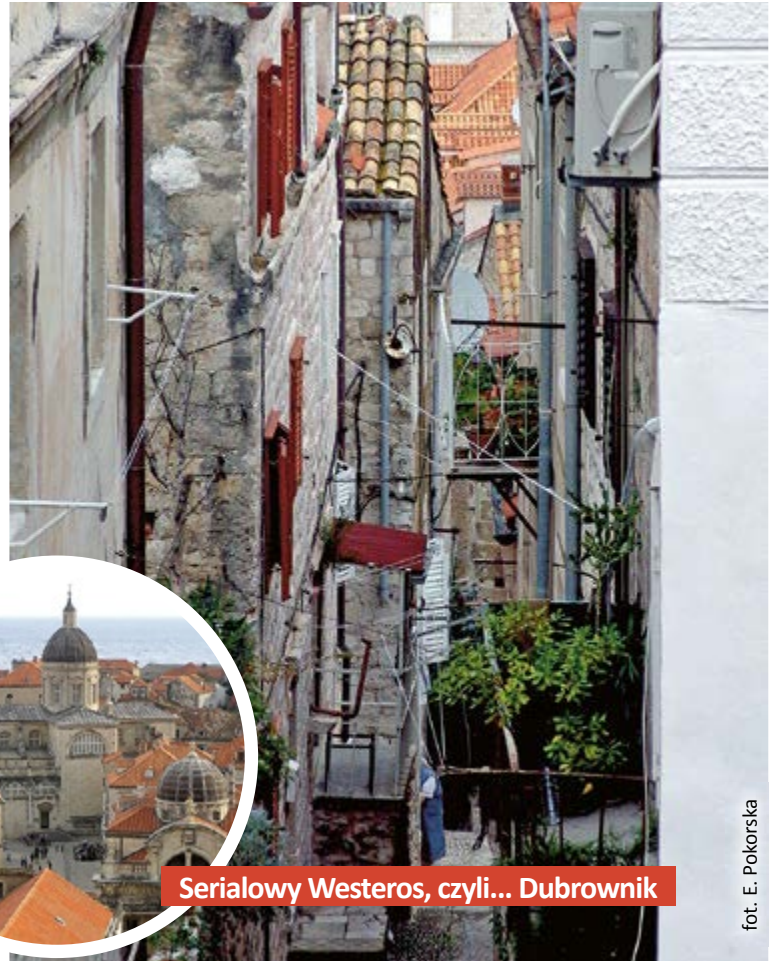
Serialowy Westeros, czyli... Dubrownik