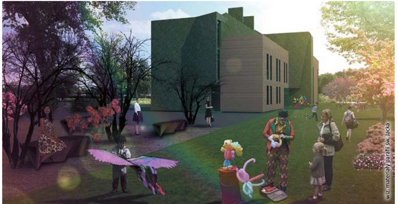
wiz. materiały parafii św. Jacka