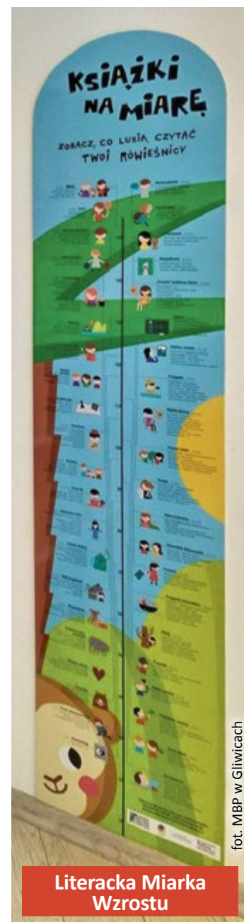
Literacka Miarka Wzrostu

bliotekach przyjemnie spędza się czas. Korzystanie ze zbiorów ułatwia jedna karta uprawniająca do wypożyczeń i zwrotów w całej sieci. Ponadto filie oferują stanowiska komputerowe z dostępem do Internetu, czytelniki e-booków, warsztaty z obsługi urządzeń multimedialnych. Bibliotekarze zapraszają i liczą na jeszcze większą frekwencję! (MBP)