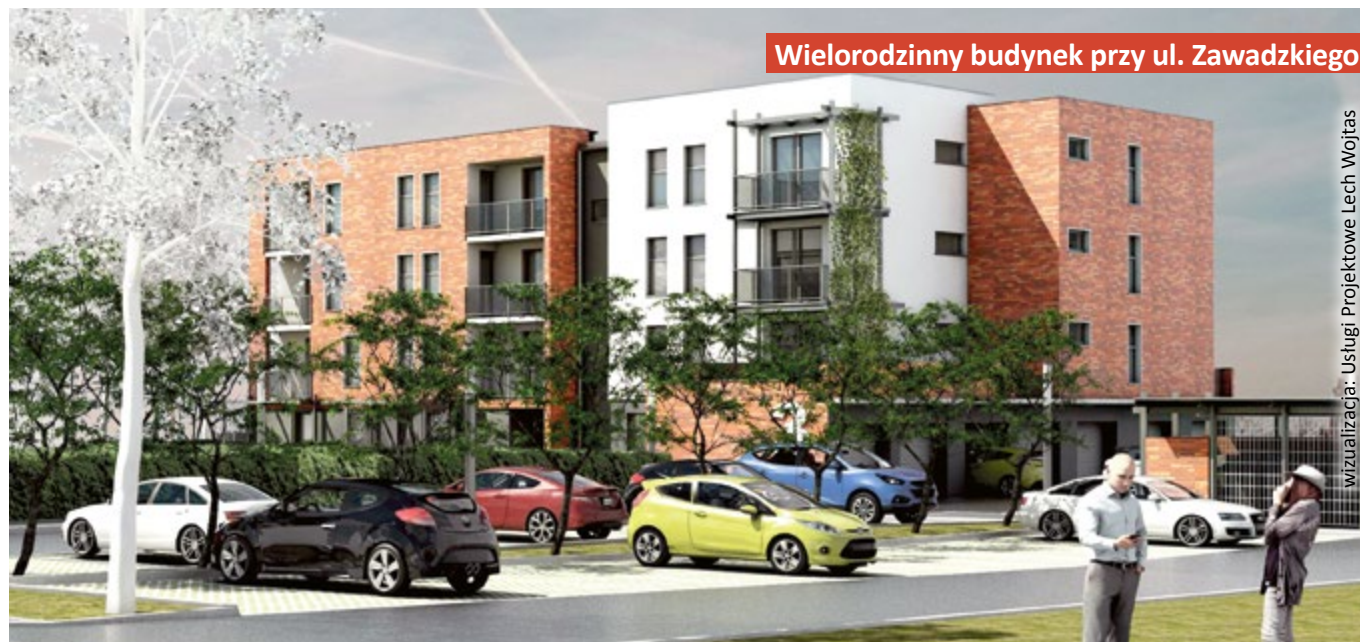
Wielorodzinny budynek przy ul. Zawadzkiego

wizualizacja: Usługi Projektowe Lech Wojtas