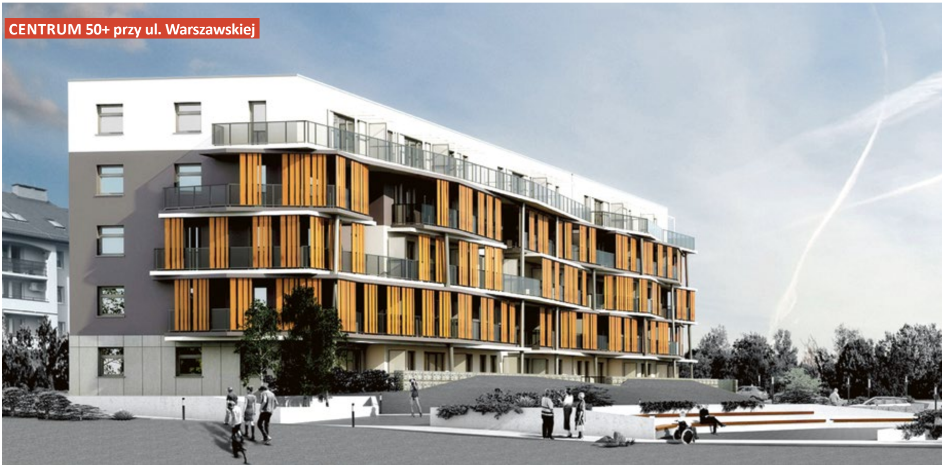
CENTRUM 50+ przy ul. Warszawskiej