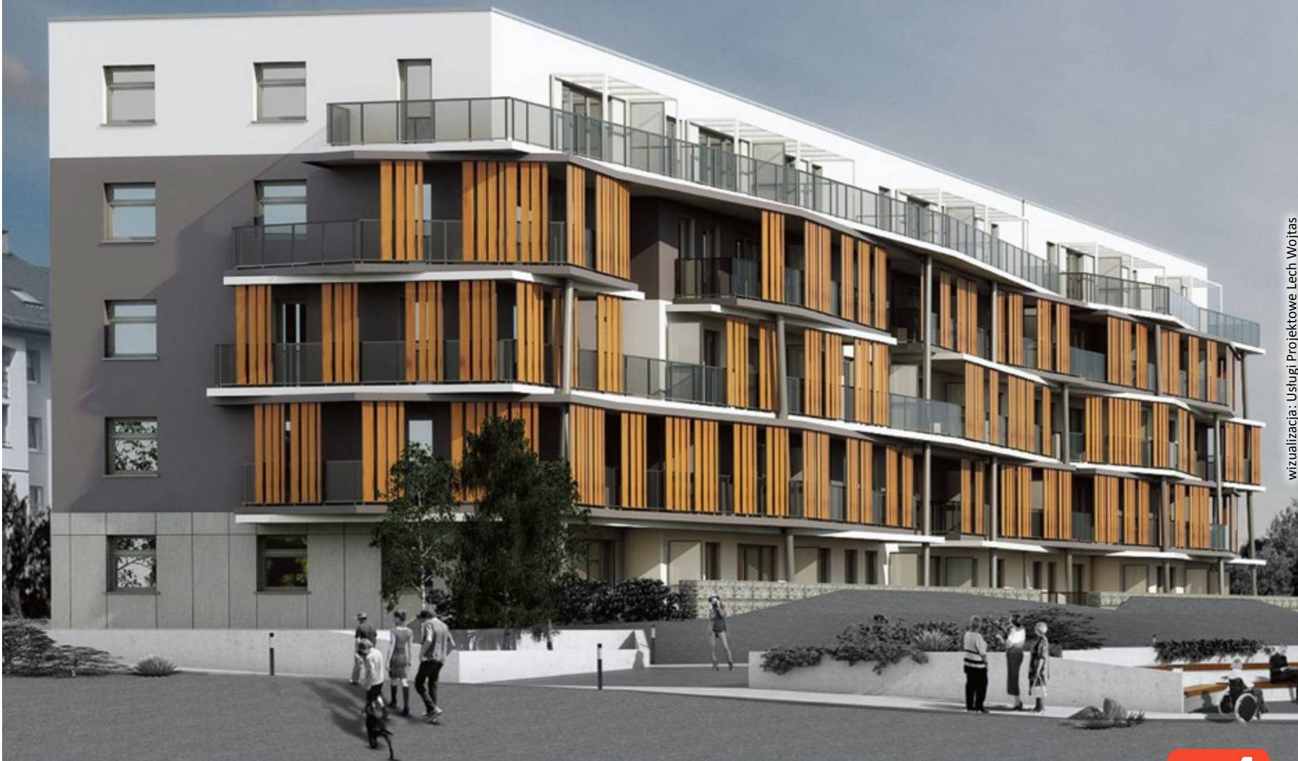
wizualizacja: Usługi Projektowe Lech Wojtas