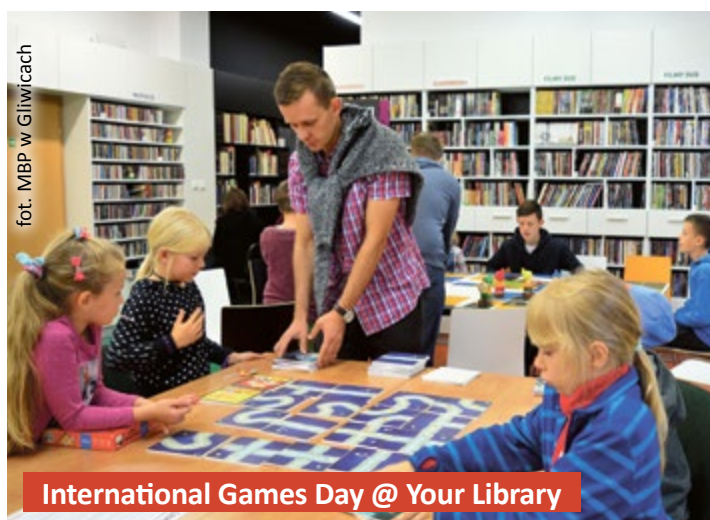
International Games Day @ Your Library

Ofertę z pewnością uatrakcyjniło 15 długofalowych projektów. Na sześć z nich biblioteka pozyskała dofinansowanie z Ministerstwa Kultury i Dziedzictwa Narodowego, dwa zrealizowano z Gliwickiego Budżetu Obywatelskiego, kolejny – dzięki współpracy z Centrum Handlowym Forum.