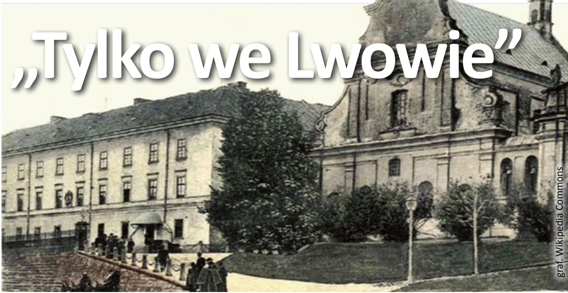
graf. Wikipedia Commons

10 lutego Przemysław Włodek, autor przewodników po Lwowie, zabierze nas w podróż po wszystkich dzielnicach perty dawnych Kresów. Bo – jak śpiewał przed laty Eugeniusz Bodo – „możliwe, że więcej ładniejszych jest miast, ale Lwów jest jedyny na świecie”.