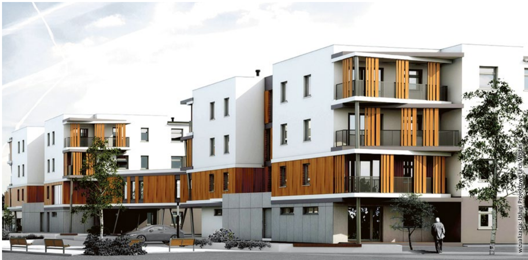
wizualizacja: Usługi Projektowe Lech Woitas

wej, Dworskiej, Bernardyńskiej, Uszczyka, Strzelniczej i Granicznej, Strzelców Bytomskich czy Mikołowskiej. Z czasem państwo wycofało się ze wspierania budownictwa społecznego.