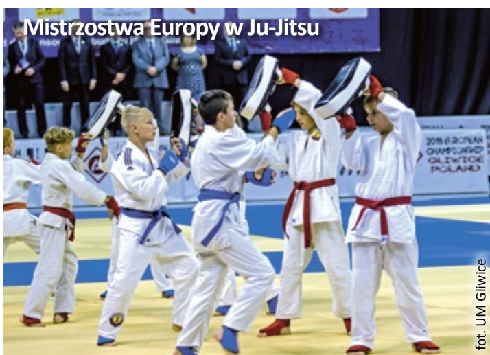
Mistrzostwa Europy w Ju-Jitsu

wickich koszykarzy i futsalistów . W ramach ekstraklasy futsalowej o miejsce na szczycie tabeli walczy Piast Gliwice, a w ramach Enea Basket Ligi i Alpe Adria Cup – koszykarski team GTK Gliwice. Mała Arena jest doskonale przystosowana do tego typu wydarzeń i spełnia wszystkie wymagania, dzięki czemu może się tam to-