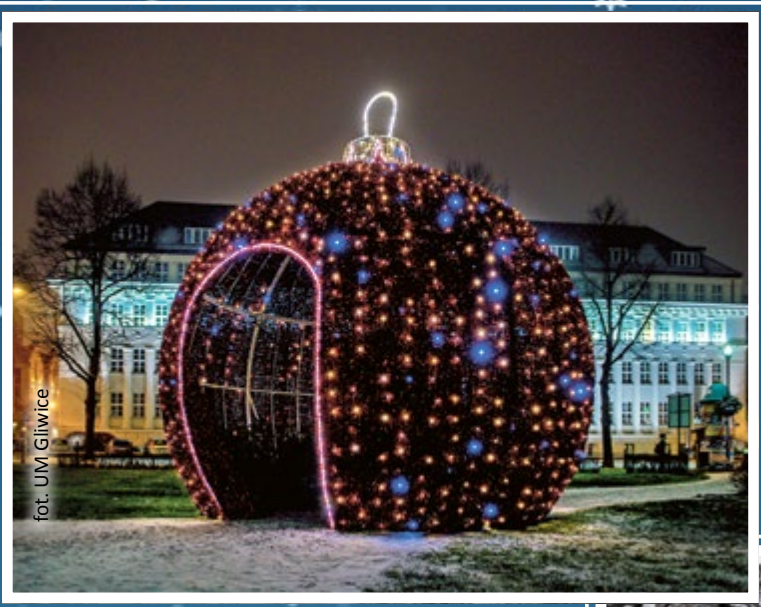
fol. UM Gliwice