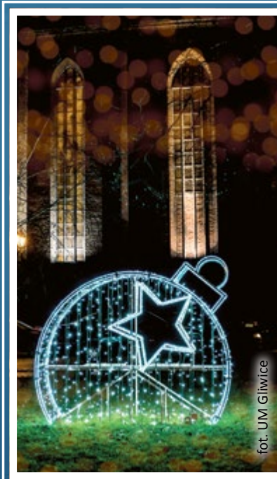
fol. UM Gliwice