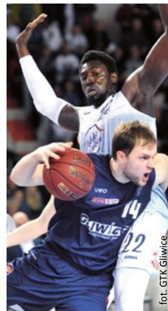
GTK Gliwice