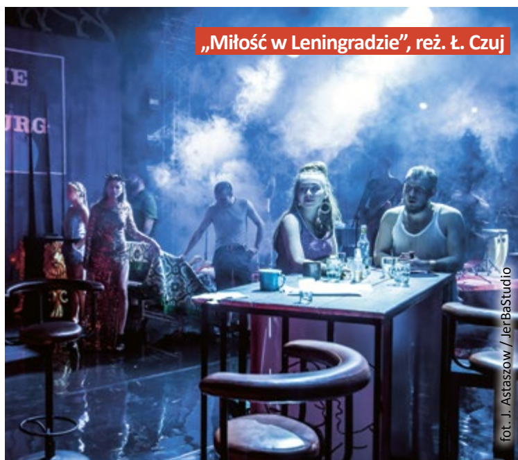
„Miłość w Leningradzie”, reż. Ł. Czuj

Ostatnie bilety na sylwestra w Teatrze są dostępne na stronie teatr.gliwice.pl . (mm)