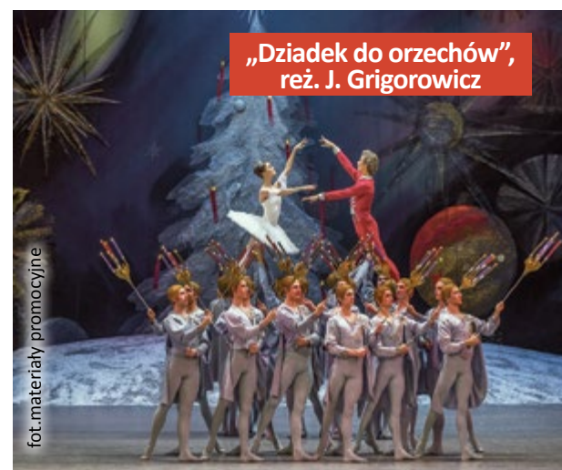
„Dziadek do orzechów”, reż. J. Grigorowicz

Bilety w cenie 35 i 40 zł można kupić w kasach kina i Teatru Miejskiego (ul. Nowy Świat 55–57) oraz na stronie amok.gliwice.pl . (mm)