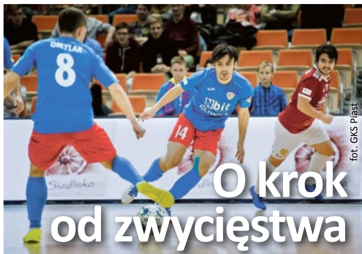
fort. GKS Piast