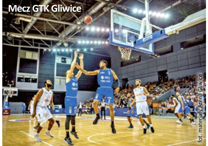
Mecz GTK Gliwice