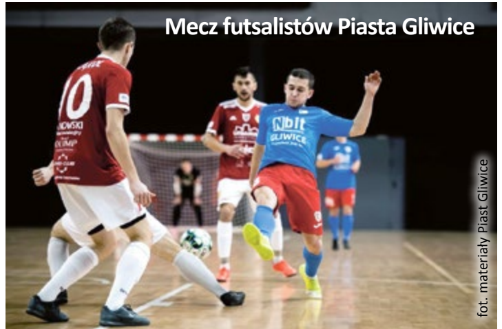
Mecz futsalistów Piasta Gliwice