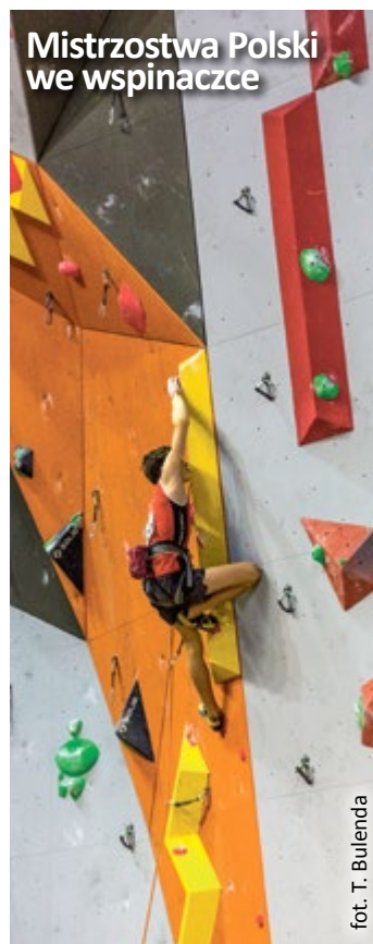
Mistrzostwa Polski we wspinaczce