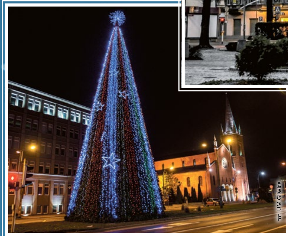
fol. UM Gliwice