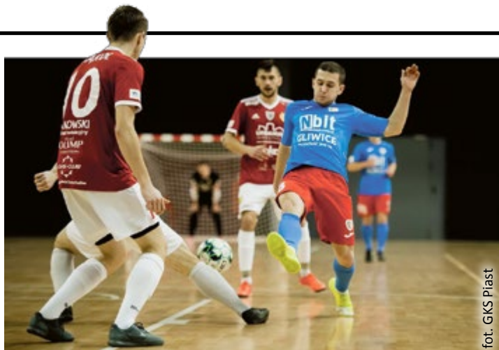
fol. GKS Piast