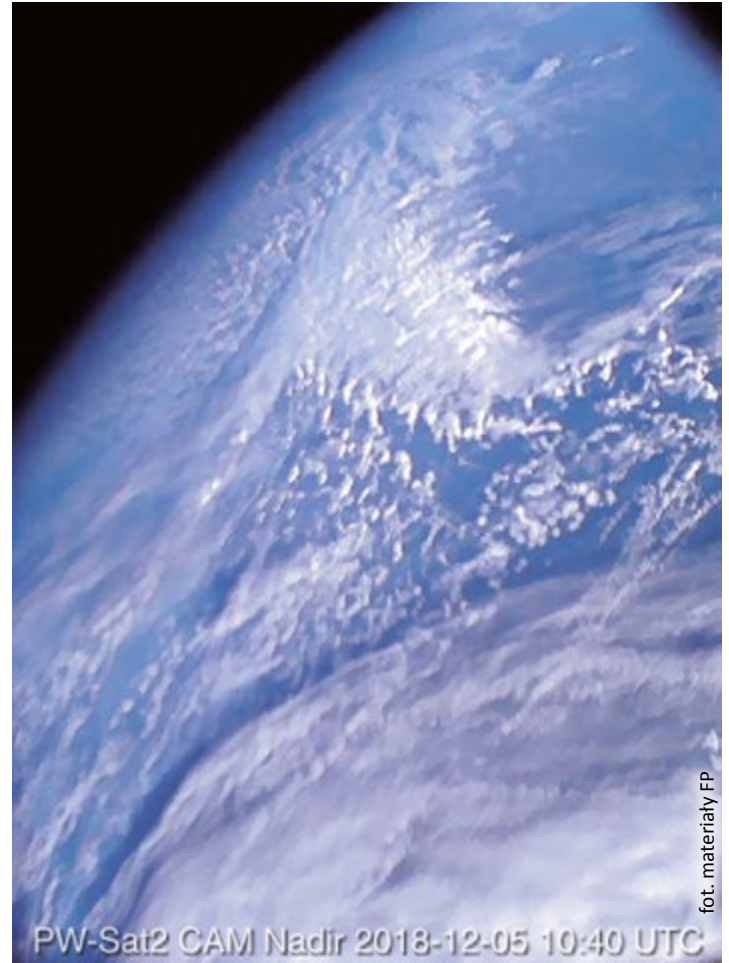
PW-Sat2 CAM Nadir 2018-12-05 10:40 UTC

Projekt PW-Sat2, realizowany przez Studenckie Koło Astronautyczne (SKA) na Wydziale Mechanicznym Energetyki i Lotnictwa Politechniki Warszawskiej, wspierają m.in. gliwickie firmy technologiczne – Future Processing i FP Instruments. (kr/FP)