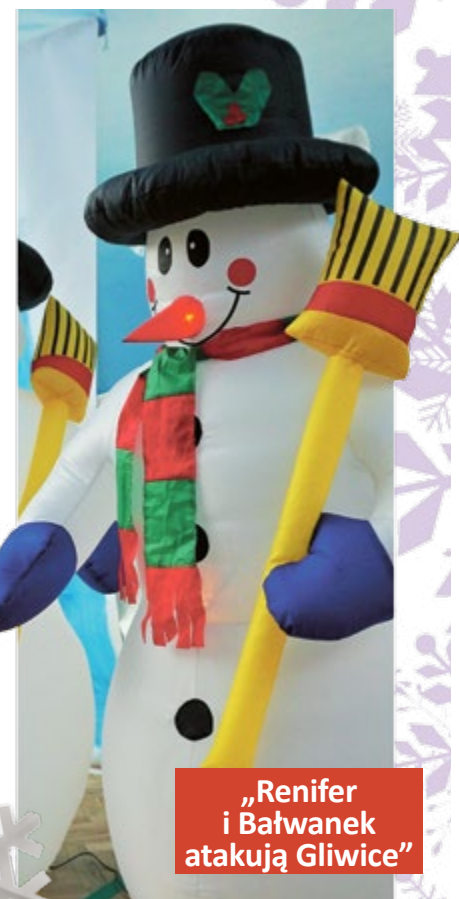
„Renifer i Bałwanek atakują Gliwice”