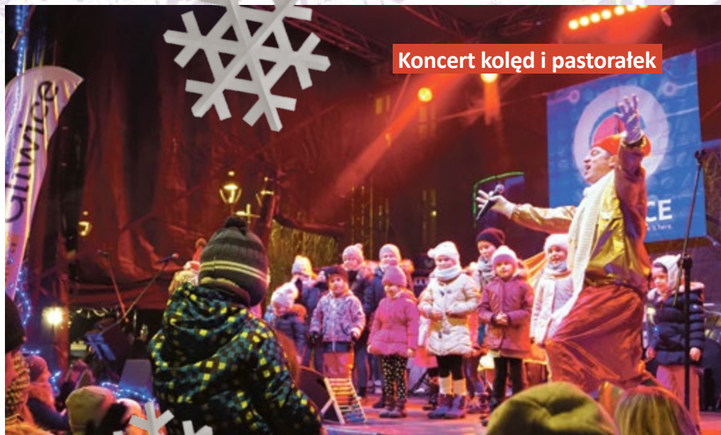
Koncert kolęd i pastorałek

Na deser – finalistka „Mam talent”, mistrzyni hula-hoop oraz kobieta guma. Wieczór zakończy nastrojowy koncert najpiękniejszych świątecznych utworów w wykonaniu zespołu Gospel Sound.