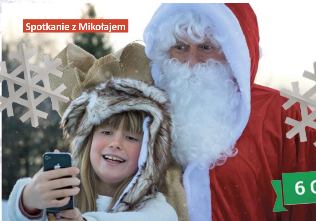
Spotkanie z Mikołajem

neczna z gliwickiego Młodzieżowego Domu Kultury, a na deser, przybyły spod samiuśkich Tater, Zespół Góralskiego, czyli czterech zacnych górali i jedna góralka.