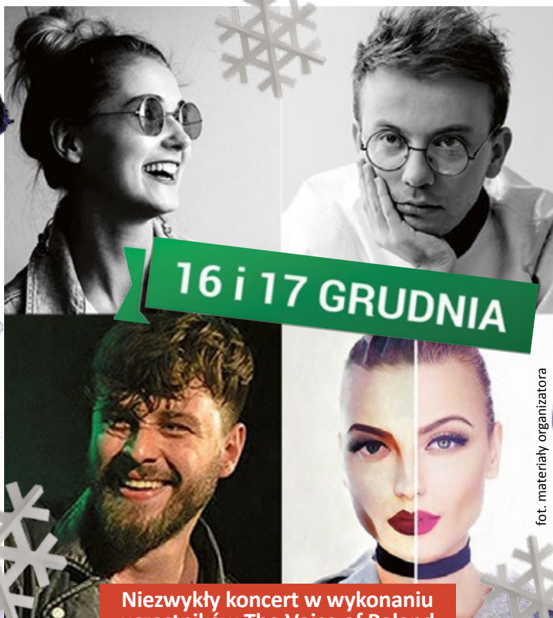
Niezwykły koncert w wykonaniu uczestników The Voice of Poland