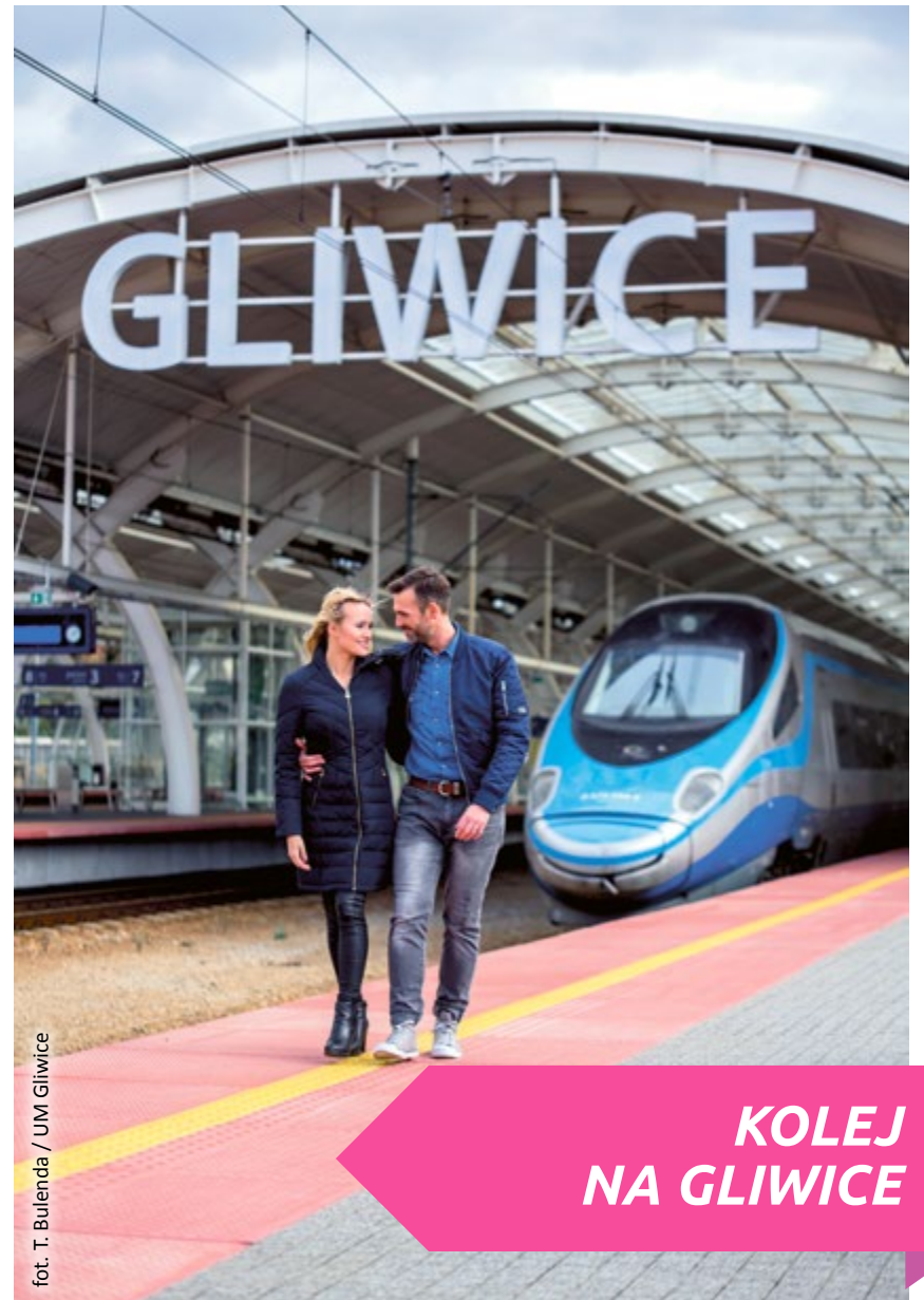
fol. T. Bulenda / UM Gliwice