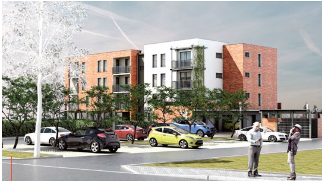
Projekt wielorodzinnego budynku przy ul. Anny Jagiellonki w Łąbędach. Wizualizacja: Centrum Projektowe Lech Wojtas

Mamy już dobrą miejską ofertę dla osób o bardzo niskich dochodach, dla których przeznaczane są odnowione mieszkania komunalne z tzw. listy podstawowej, a także propozycję dla mieszkańców nieco lepiej zarabiających, uprawnionych przez to do najmu mieszkań komunalnych wymagających remontu. Do osób średnio sytuowanych i zarabiających dużo (do określonego poziomu)