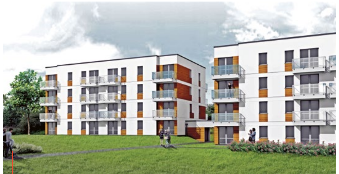
Projekt budynków komunalnych przy ul. Kujawskiej w Ligocie Zaborskiej. Wizualizacja: Pracownia Projektowa Daniel Płocica