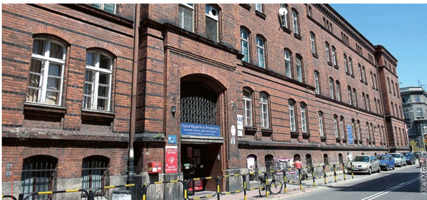
fol. UM Gliwice

Co z planami przygotowanymi na potrzeby poprzedniej koncepcji? Program funkcjonalno-użytkowy, przygotowany na zlecenie poprzedniego zarządu szpitala przez Pracownię Projektową STUDIO QUATTRO z Katowic, może z powodzeniem być wykorzystany przy projektowaniu nowego kompleksu. Gdzie mógłby zostać wybudowany nowy szpital? Trwają analizy zmierzające do wybrania optymalnej lokalizacji. (ap)