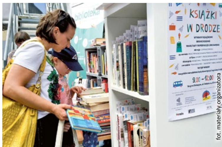
fol. materiały organizatora