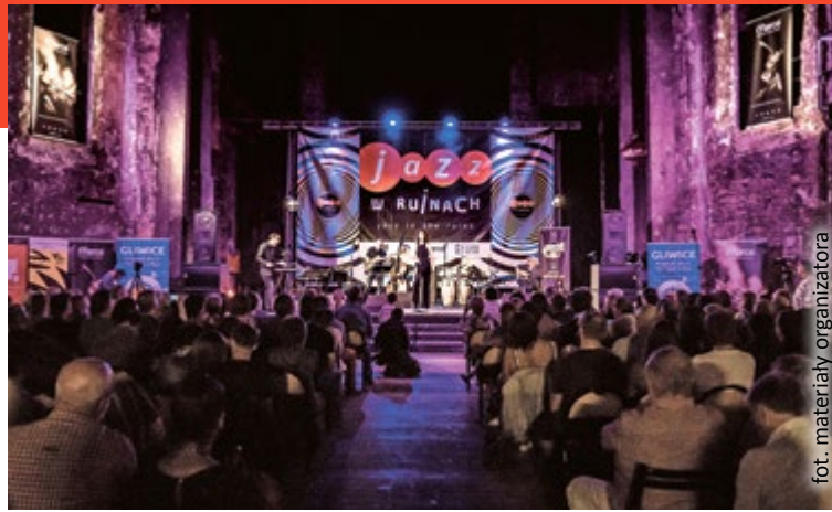
fol. materiały organizatora

Jazz w Ruinach to festiwal, który warto mieć na oku. Przy al. Przyjaźni co roku prezentują się artyści, którzy mimo krótkiego stażu scenicznego zapowiadają się na gwiazdy jazzu. Historia imprezy pokazuje, że Śląski Jazz Club ma nosa do zdolnych muzyków. Jazz w Ruinach 2018 startuje 3 sierpnia!