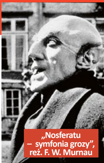
„Nosferatu – symfonia grozy”, reż. F. W. Murnau

ElektrONarracje zaplanowano na 6, 13, 20 i 27 lipca o godz. 20.00. Szczegółowy program festiwalu jest dostępny na stronie kultura.gliwice.eu . Organizatorem wydarzenia jest Stowarzyszenie Inicjatywa. Projekt jest dofinansowany z budżetu Miasta Gliwice. (mm)