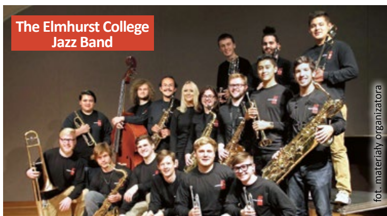
The Elmhurst College Jazz Band

Wszystkie koncerty będą rozpoczynać się o godz. 19.00 w Jazovii. Na trzy z nich można zdobyć bezpłatne zaproszenia za pośrednictwem strony internetowej zaproszenia.jazovia.pl . Sprzedaż biletów na koncert Natalii Przybysz i The Elmhurst College Jazz Bandu jest prowadzona w Teatrze Miejskim w Gliwicach oraz na portalu ticketmaster.pl . (mm)