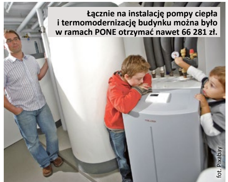
Łącznie na instalację pompy ciepła i termomodernizację budynku można było w ramach PONE otrzymać nawet 66 281 zł.

Ponadto mieszkańcy ubiegający się o dofinansowanie do pompy ciepła mogli wnioskować także o dotację do prac termoizolacyjnych: docieplenia ścian, docieplenia stropodachów albo wymiany okien i drzwi zewnętrznych, jeżeli konieczność wykonania określonych prac