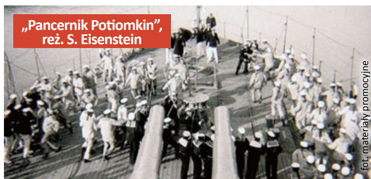
„Pancernik Potiomkin”, reż. S. Eisenstein