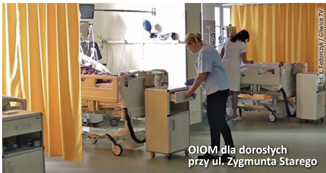
OIOM dla dorosłych przy ul. Zygmunta Starego

– Tylko w ciągu ostatniej dekady wydaliśmy na gliwickie szpitalnictwo około 54 miliony zł, przeznaczając je na niezbędne inwestycje, zakup sprzętu, a także spłatę za-