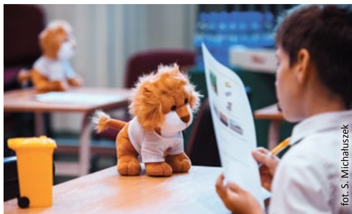
fol. S. Michaluszek

Dzieci z ogromnym zaangażowaniem i entuzjazmem podeszły do półfinału, który