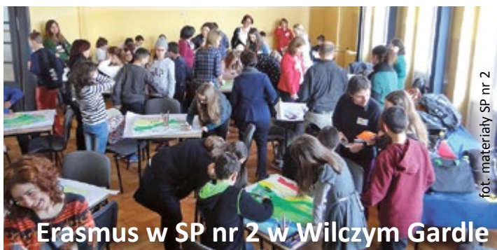
fol. materiały SP nr 2

Uczniowie uczestniczący w zajęciach kółka kulinarnego mogą w praktyce wykazać się swoimi umiejętnościami, rozwijać talenty gastronomiczne i zainteresowania. Tematyka jest urozmaicona i dostosowana do pór roku czy