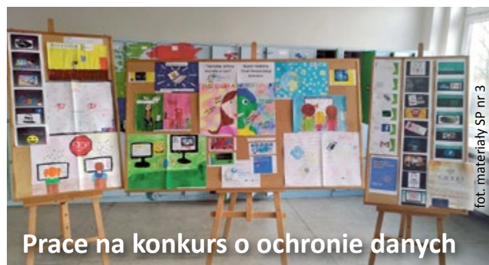
fol. materiały SP nr 3

To tylko niektóre z długiej listy zajęć pozalekcyjnych oferowanych przez szkoły. Warto się zapoznać z ofertą placówek w najbliższej okolicy, bo to właśnie one – poza tradycyjnymi lekcjami – pozwalają dzieciom najlepiej rozwijać pasje, zainteresowania i umiejętności. (kr)