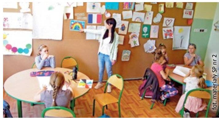
fol. materiały SP nr 2

O tym, że warto znać wiele języków, nie trzeba w obecnych czasach nikogo przekonywać. Dobrze o tym wiedzą także uczniowie gliwickich szkół podstawowych, którzy korzystają z dodatkowych zajęć pozalekcyjnych z języka francuskiego, hiszpańskiego i niemieckiego.