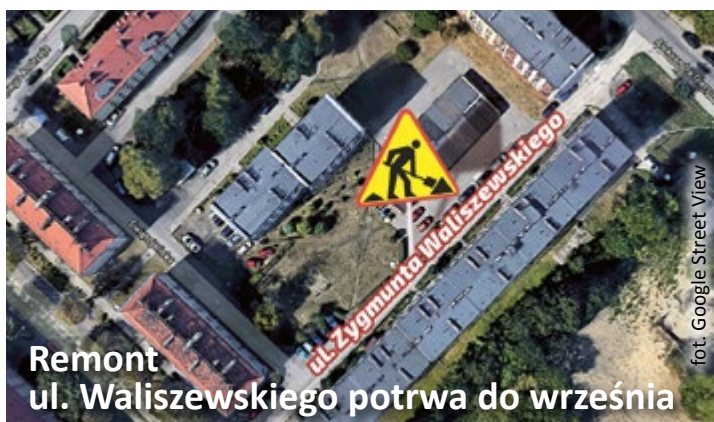
Remont ul. Waliszewskiego potrwa do września

W czwartek 14 czerwca rozpoczną się prace remontowe nad rzeką Bytomką na węźle DK88 przy ul. Chorzowskiej. Prace będą prowadzone etapami, przy zachowaniu ruchu w obu kierunkach.