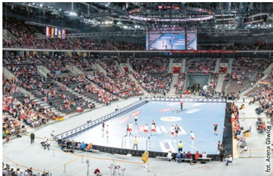
fol. Arena Gliwice