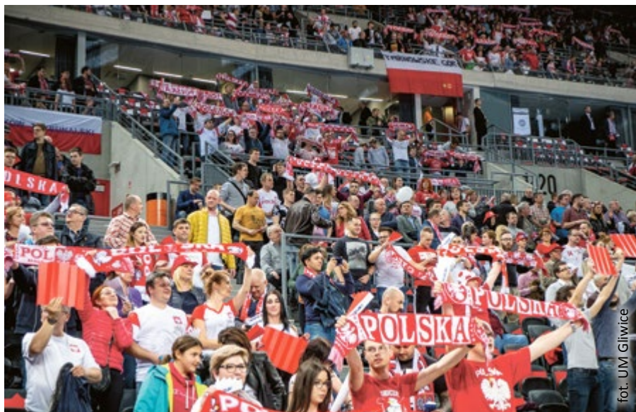
fol. UM Gliwice