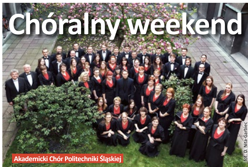
Akademicki Chór Politechniki Śląskiej