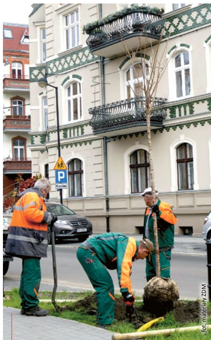
fol. materiały ZDM

Inwentaryzacja zieleni miejskiej zrealizowana została w oparciu o dane fotogrametryczne pozyskane z nalotów lotniczych wykonanych w marcu 2017 r. w ramach projektu „Wsparcie rozwoju cyfrowych usług publicznych w zakresie dostępu do danych i procedur planistycznych w Urzędzie Miasta w Gliwicach”. (mf)