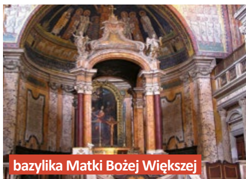
bazylika Matki Bożej Większej

eurowejscy artyści, z Michałem Aniołem na czele. Niepowtarzalna okazja, żeby pospacerować po nich w towarzystwie ekspertów – historyków sztuki i muzealników – nadarzy się 8 kwietnia dwukrotnie, o godz. 16.00 i 18.15. Bilety na seanse są do kupienia w kasie i na stronie amok.gliwice.pl . (mm)