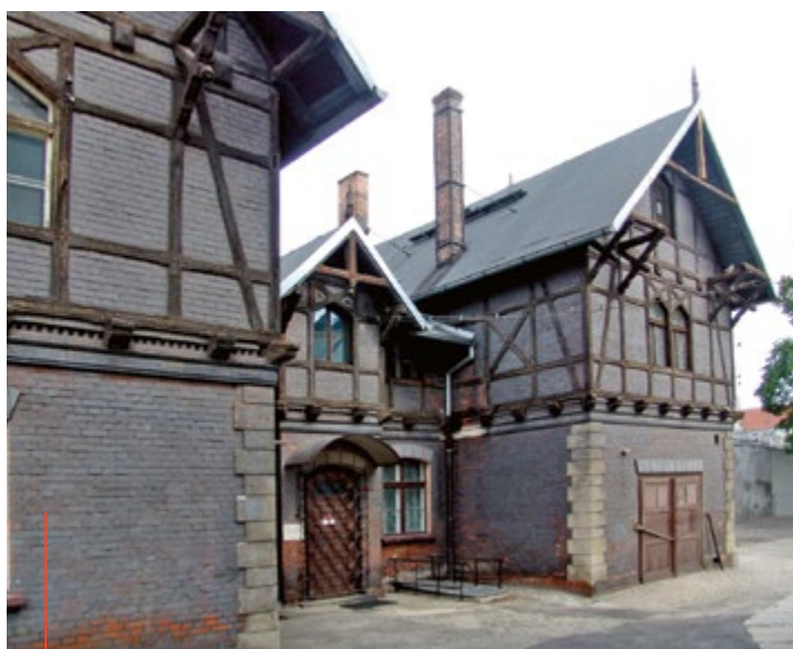
Mur pruski, bardzo popularny w Niemczech i państwach Europy Północnej, na zabudowaniach towarzyszących szkole muzycznej