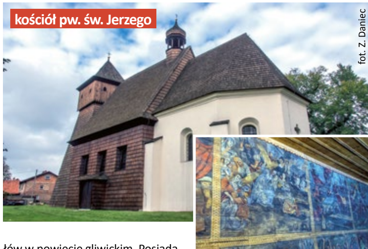
kościół pw. św. Jerzego

Świątynia przy ul. Kozielskiej to jeden z najlepiej zachowanych tego typu obiektów na Górnym Śląsku. Kościół powstał w 1493 roku w Zębowicach, do Gliwic trafił w 1925 roku. To jeden z pięciu XV-wiecznych drewnianych kościo-