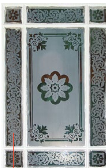
Efektowne przeszklenia z trawionego szkła we wnętrzach budynku szkoły muzycznej