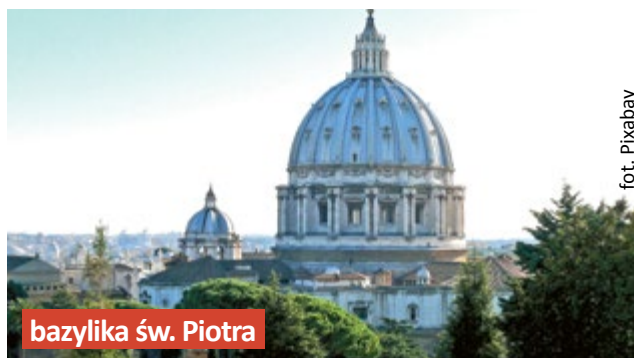
bazylika św. Piotra