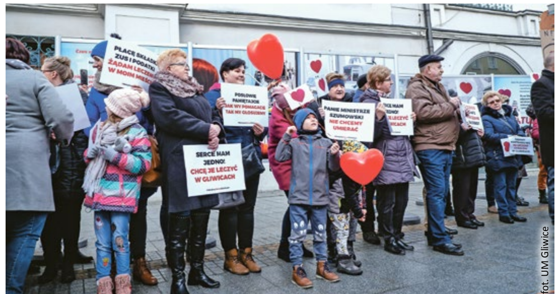
fol. UM Gliwice