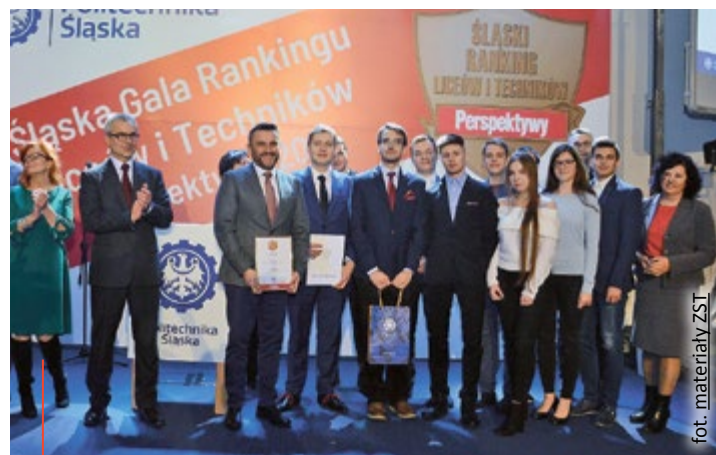
Podczas gali na Politechnice Śląskiej wyróżniono 15 najlepszych liceów i 15 najlepszych techników z województwa śląskiego.

Wśród szkół technicznych bezkonkurencyjne okazało się Technikum nr 1 w ZS Techniczno-Informatycznych w Gliwicach. W grupie liceów na 7. pozycji w śląskim rankingu Perspektyw uplasowało się gliwickie Liceum Ogólnokształcące FILOMATA, a na 13. pozycji – I LO im. E. Dembowskiego w ZSO nr 10. (kik)