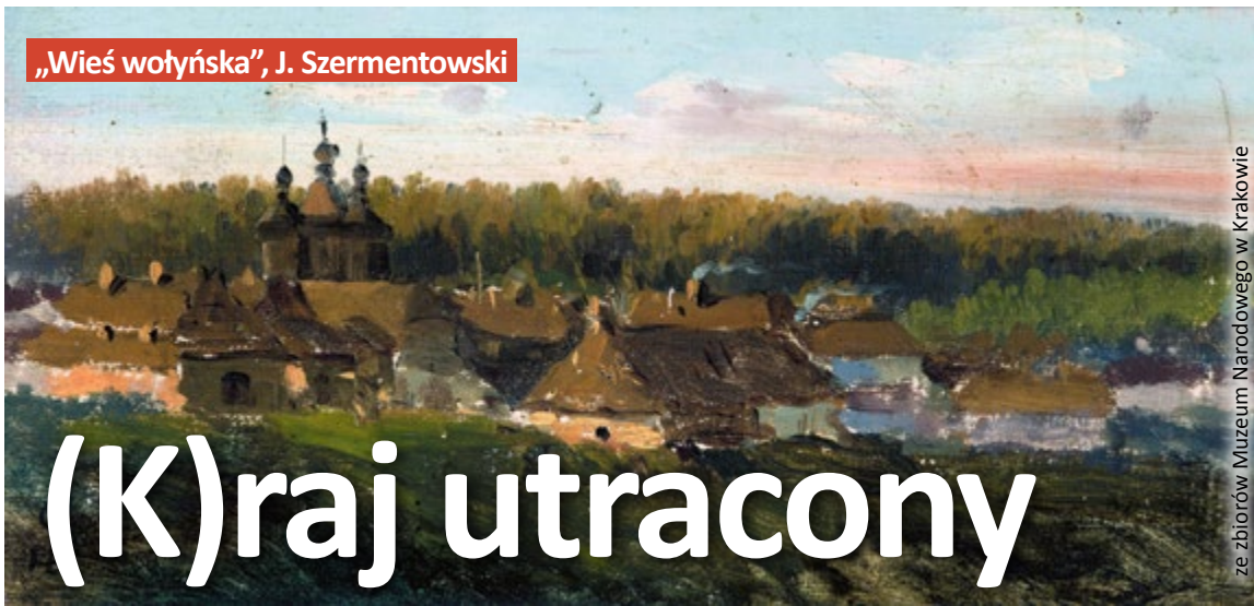
„Wieś wołyńska”, J. Szermentowski