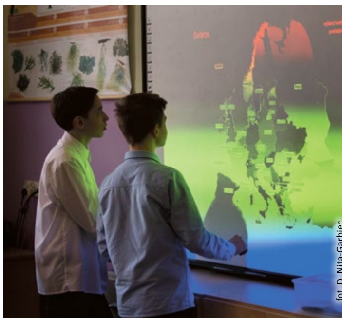
fol. D. Nita-Garbiec