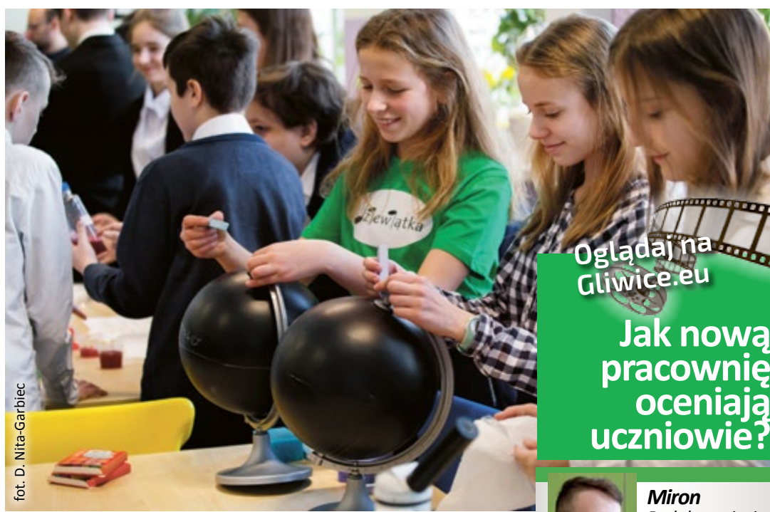
fol. D. Nita-Garbiec