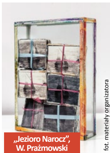
„Jeziro Narocz”, W. Prażmowski

Wystawa zostanie otwarta w czwartek 14 lutego o godz. 18.00. Kuratorką ekspozycji jest Anka Sielska. Prace Wojciecha Prażmowskiego będzie można oglądać w Gliwicach do 21 kwietnia. (mm)