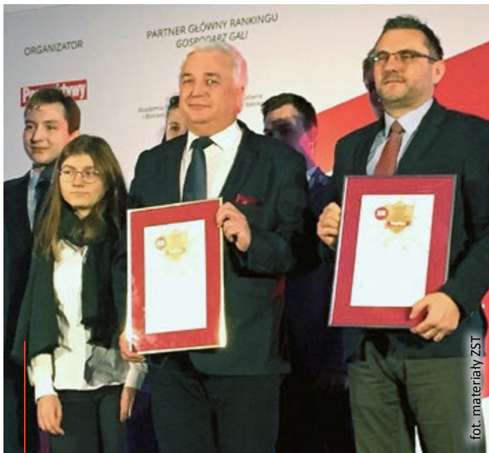
fol. materiały ZSTI