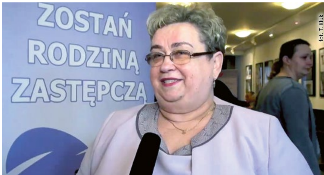
fol. T. Kluk

Szczegółowe informacje dotyczące działalności zawodowych rodzin zastępczych można znaleźć w Centrum Pieczy Zastępczej i Wspierania Rodziny (ul. generała Władysława Sikorskiego 134, tel. 32/335-41-37). (mf)